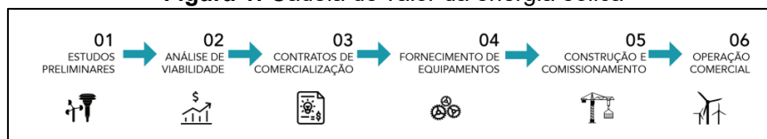
Figura 1: Cadeia de valor da energia eólica

eólica; células solares em módulos ou painéis; conversores elétricos; e instrumentos e aparelhos de geodésia e topografia (FIERN, 2022). Sendo assim, apesar do RN apresentar excelentes indicadores na produção de energias renováveis, sobretudo, eólica, o estado ainda tem baixo potencial indutor de emprego e de geração no setor e, também, no encadeamento com outros setores da economia, justamente por sua dependência em importar máquinas, equipamentos, insumos, entre outros. A figura 1 abaixo ilustra como os elos da cadeia produtiva da energia eólica se relacionam entre si, e mostra as oportunidades que o RN perde em não internalizar parte ou totalmente a cadeia de valor da energia eólica.